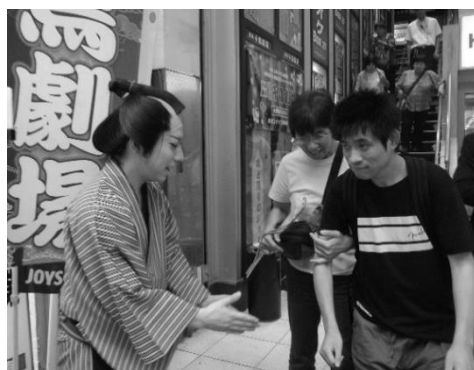
高槻市・千鳥劇場にて

あらぐさでは働いたお金で大衆演劇をグループの皆で観劇に行くことも楽しみにしています。