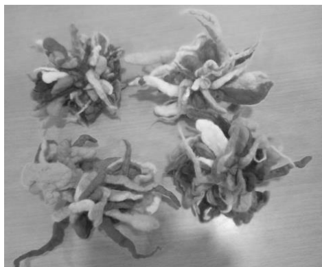
フェルトのコサージュ作品「万華鏡」