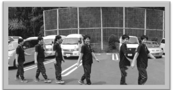
パノラマ機能を使って「忍者の影分身」(?)を表現しました。

二つ目はカメラ同好会です。写真を自分で撮りたい、カメラ（機械）に興味のあるメンバーが集まって、カメラ同好会はできました。色々な場所に行き、写真を自分で撮る機会を作っています。この間はJR長岡京駅に写真